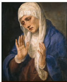
Den sørgjande Maria, måla av Tizian (ca. 1488–1490).